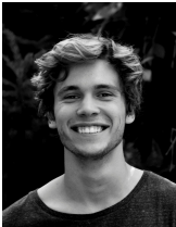
Sascha Müller | Fotograf