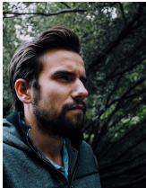
Jason Hodel | Fotograf

Wir freuen uns von Ihnen zu hören. Sascha & Jason